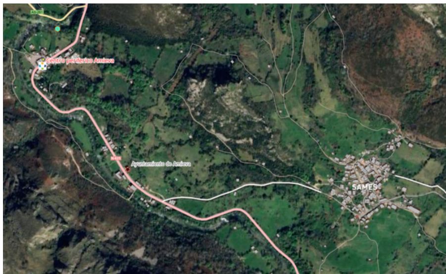
Ubicación de los principales núcleos y servicios de Amieva

El estudio técnico analiza cómo se mueve la gente en los tres concejos que forman la Mancomunidad (Amieva, Cangas de Onís y Onís) y detecta varios problemas que hacen difícil que todos los vecinos puedan acceder en igualdad de condiciones a servicios básicos como la sanidad, la educación o las gestiones diarias. Además, se señala que el transporte público tradicional no funciona bien en este tipo de territorio tan disperso y con pueblos pequeños y alejados entre sí.