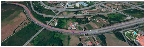
Matriz 03 - Glorietas AP-9 B y C AM 8:00 y PM 19:00